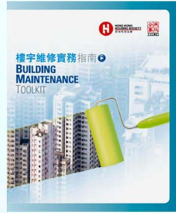
樓宇維修實務指南