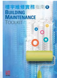
新版樓宇維修實務指南