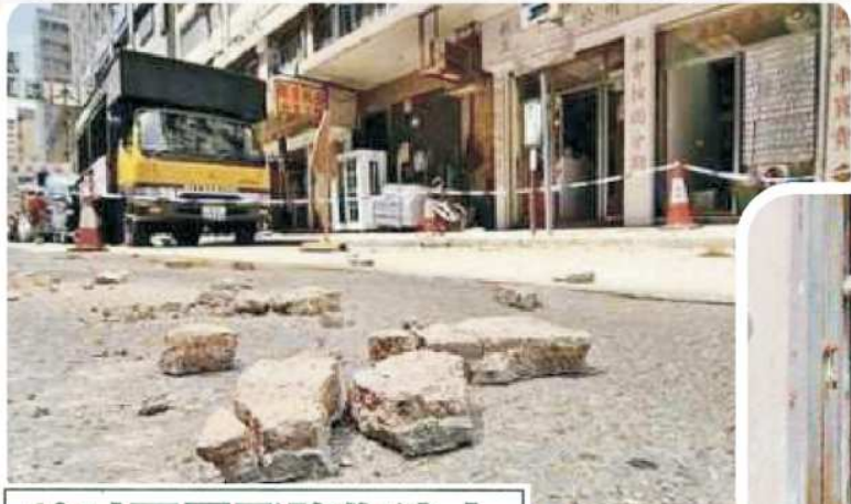
10吋石屎飛墮傷途人