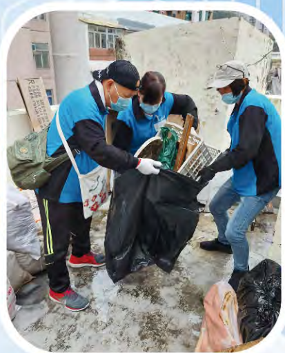
合力清理天台的雜物及垃圾