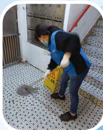
清潔及打掃大廈梯間公用地方