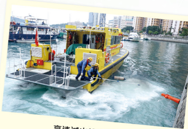
高速滅火輪救援示範