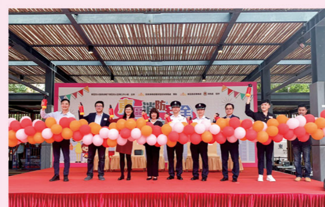
嘉賓主持開幕儀式