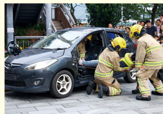
公路拯救刻不容緩