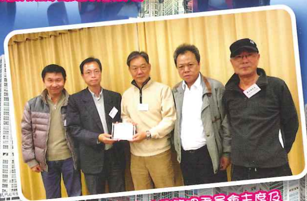
景盛苑業主立案法團管理委員會主席及委員接受大會致送的紀念品