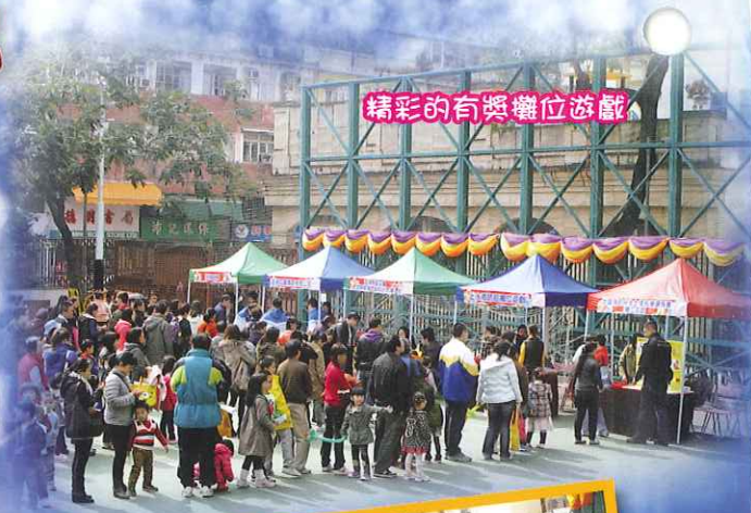
精彩的有獎攤位遊戲

活動日當天除了有防火宣傳和消防設備展覽外，更有消防員進行專業滅火和救護示範，透過有獎攤位遊戲、問答遊戲，以及消防人員的生動講解，活動成功地向在場參觀的市民帶出防火信息。