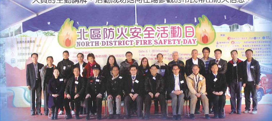
主禮嘉賓於典禮後合照