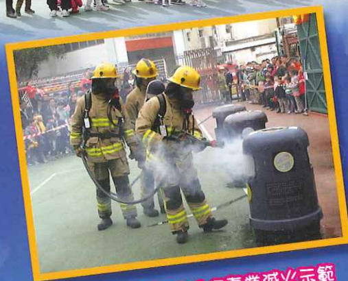
消防員進行專業滅火示範