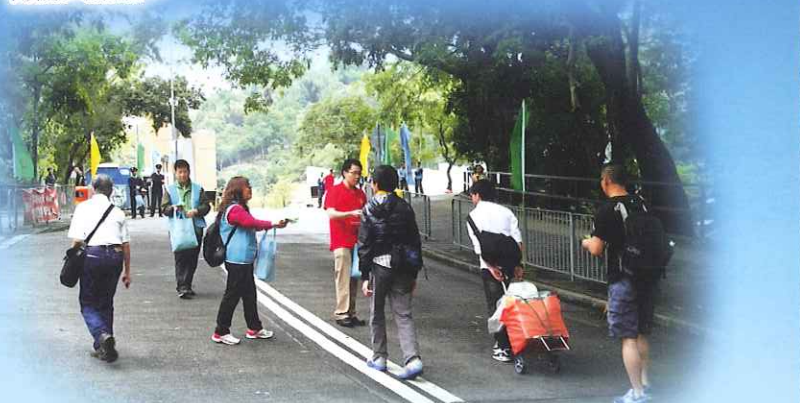
北區防火委員會委員於和合石殯葬區派發防火宣傳品。

北區防火委員會於清明節期間(2013年4月6日)聯同北區消防安全大使，前往和合石殯葬區向掃墓人士派發精美防火宣傳品及防火單張，提醒孝子賢孫掃墓不忘防止山火；本會又租用流動廣播車於當日穿梭北區山火黑點，宣傳防火訊息。