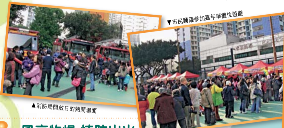
消防局開放日的熱鬧場面