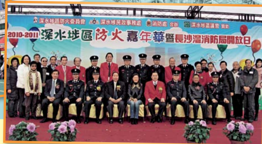
主禮嘉賓與各委員合照

必須選用合規格的電器。注意電路及電線的保護，避免電器負荷過重及在同一插座上使用多於一個萬能蘇，並切勿將過多的電掣連接於同一插座上。不要使用有裂縫、有過熱迹象(如變色、焦黑、變形)或有鬆脫現象的插頭。如發生保險絲或斷路器斷開，可能是由於過多電器使用同一電路所致。更換保險絲或斷路器必須由及格電器技師進行。如有使用電器而發生燒保險絲或斷路器斷開的情形，則可能是電線發生故障，應即由及格電器技師進行檢查。