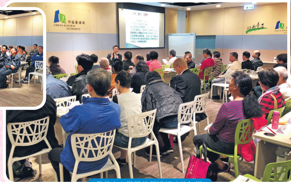
學員專心聆聽律師講解法律知識