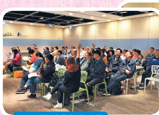
學員積極參與課堂活動