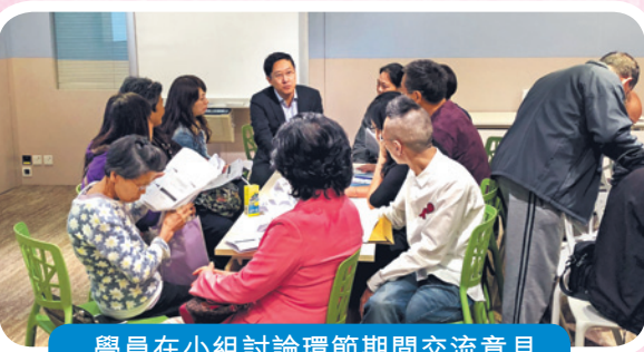
學員在小组討論環節期間交流意見