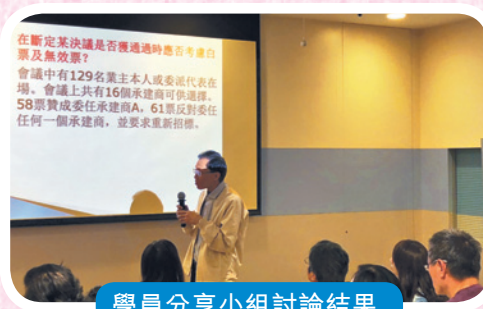
學員分享小组討論結果