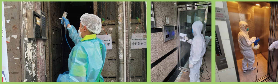
消毒人員在公用地方噴灑防疫消毒塗層

油尖旺民政事務處透過新的油尖旺社區參與計劃，撥款予社區團體舉辦「舊樓消毒齊抗疫」，為區內合資格大廈在公用地方一次性噴灑防疫消毒塗層。活動已於1月中旬開始，逾300幢大廈已受惠，消毒範圍包括舊式大廈大堂、電梯內櫃及按鈕，或單幢唐樓樓梯及扶手等較多人接觸的地方。噴灑消毒液後的地方表面會形成抗菌抗病毒塗層，保護效力長達180天。