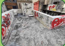
天台公用部分清潔後的情況