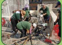
清潔工人為區內“三無大廈”天台公用部分進行清潔工作