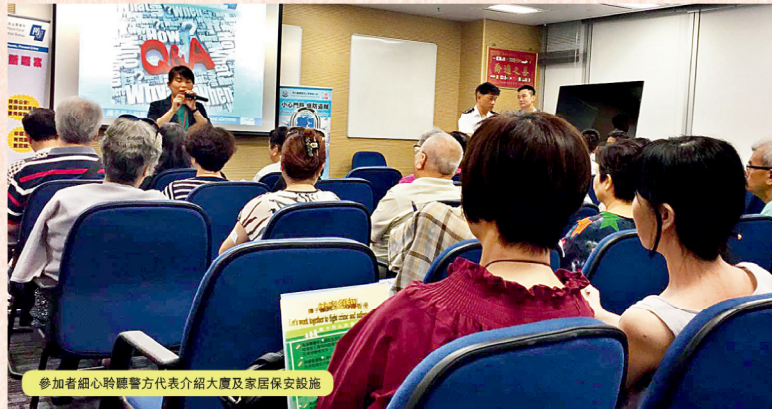
參加者細心聆聽警方代表介紹大廈及家居保安設施