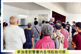
參加者對警署內各項設施均感到新奇,並專心聆聽講解。