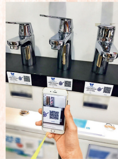
市民可用智能電話掃描標貼上的二維碼,掃瞄成功後,即可查閱水喉產品的生產地、質量保證等資料。

無論是家具店還是五金舖,櫥窗內都有林林總總的水龍頭。選購時,有些消費者看重款式,有些則看重功能,而以價格為先決條件的也大有人在。但大家如不知道,選購水喉產品有機會影響食水安全,如果能夠使用符合法定物料標準的水龍頭,對食水安全會更有保證。 根據《水務設施條例》(《條例》)及《水務設施規例》(《規例》),所有新建內部供水系統所採用的供水喉管及裝置,例如水龍頭、閘門及焊接物料等,均須符合法定的物料標準。水務監督會為