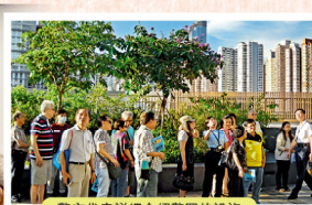
警方代表詳細介紹警署的設施