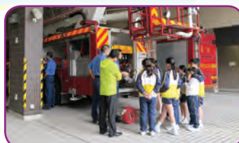
同學專心聆聽消防員講解消防車的設備