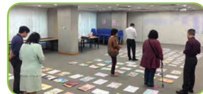
評審團仔細地評審參賽作品

比賽的反應十分踴躍，共接獲逾千份參賽作品。評審團已選出得獎作品。頒獎禮於12月4日在卑路乍灣公園舉行，同日亦會展出得獎作品。