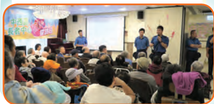
消防員向長者講解消防知識

防火委員會委員及香港消防處代表探訪香港聖公會西環長者綜合服務中心、保良局西營盤護老院暨長者日間護理中心及香港聖公會聖馬太長者鄰舍中心，藉透過講座提升長者的防火意識。