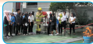
學員專心學習使用各種消防設施

訓練班在上環消防局舉辦，31名印尼籍學員順利通過考核，成為消防安全大使的新力軍。