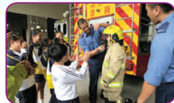
同學試穿「黃金戰衣」，體驗消防員的工作辛勞