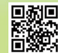
職安健星級企業名冊