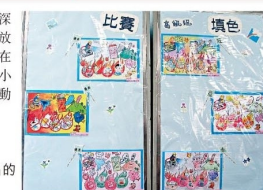
(圖為部分作品的展覽相片。)

各得獎者已於2009年1月4日於「深水埗區防火嘉年華暨長沙灣消防局開放日」領取其獎項。深水埗區防火委員會在此再次祝賀各得獎者，同時感謝區內小學及幼稚園的支持及協助，使是次活動能夠得以順利完成。